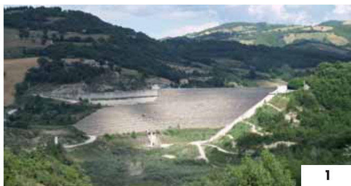
Foto 1 Il vasto invaso della diga di Casanova non ancora in esercizio