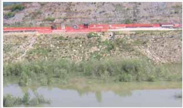
Il fondo del allagato del bacino Sopra

due gruppi di pompaggio per un totale di sei pompe che garantiscono una portata complessiva di 1.500 l/s alla bocca delle due tubazioni di mandata. Tale portata massima è stata ripartita tra in diverse pompe in modo da assicurare anche una portata minima di 200-250 l/s. Ciascun gruppo di pompaggio si compone di 3 elettropompe sommergibili, un gruppo elettrogeno da 450kVA e una condotta premente in acciaio DN 700 mm con sbocco nella galleria di derivazione di circa 80 m di lunghezza. L'impianto comprende, inoltre, una sonda di livello piezoresistiva e un quadro elettrico di comando e protezione. Sono così gestite le sequenze di automazione come l'avvio ed arresto delle elettropompe a livelli prefissati, attivazione allarmi etc.